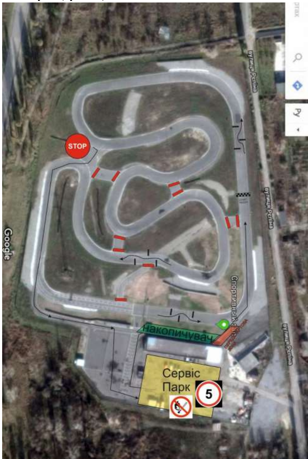
Схема траси (приклад)